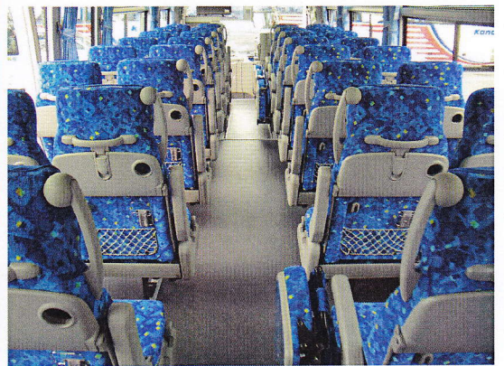
ご利用状況により通常の座席を取り付けることも可能です。

乗車定員：37人乗り（正席29+補助席4+車椅子固定席4） ※車椅子固定席に通常の座席（16席分）を取り付けた場合、49人乗りになります。