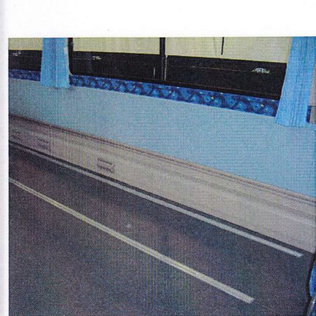
車椅子の様々なタイプに対応できるように固定箇所がレール式になっております。

車内は、車椅子を4台固定可能！！ (車椅子のご利用がない場合は、通常の座席を取り付けております。) ご利用の台数により座席の取り付けが可能です。 ※車椅子1台につき、座席4席分のスペースを使用します。